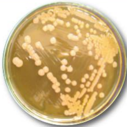
Paenibacillus larvae caractere culturale pe agar BHI cu adaos de THCl și AN

Din partea organismului larvei infectate se observă o reacție de apărare exprimată prin creșterea indicelui fagocitar, însă capacitatea hemocitelor fagocitare